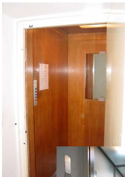
Kabine vor der Modernisierung