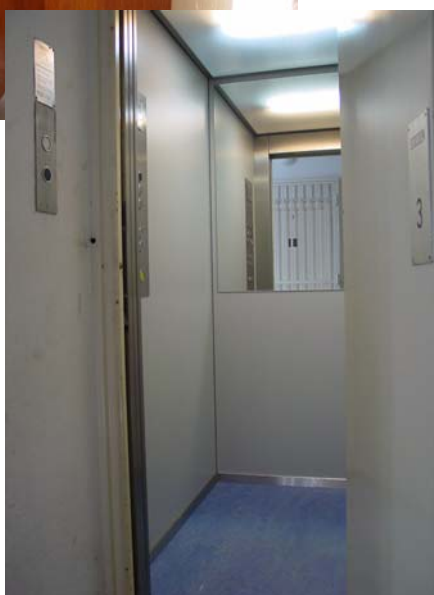
Kabine nach der Modernisierung mit automati- scher Kabinen- schiebetüre