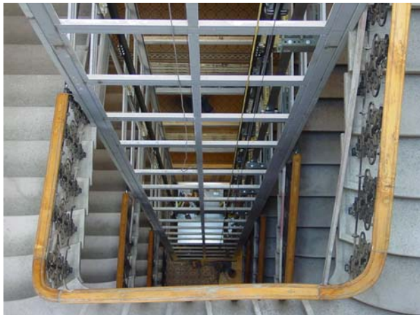
Triebwerksraumlose Aufzugsanlage derzeit in Bau